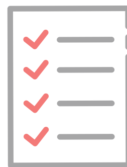
お客様への健康チェック

当院では、患者様に安心して ご来院いただけますよう予防対策を徹底しております。 ご理解と、ご協力の程宜しくお願いいたします。